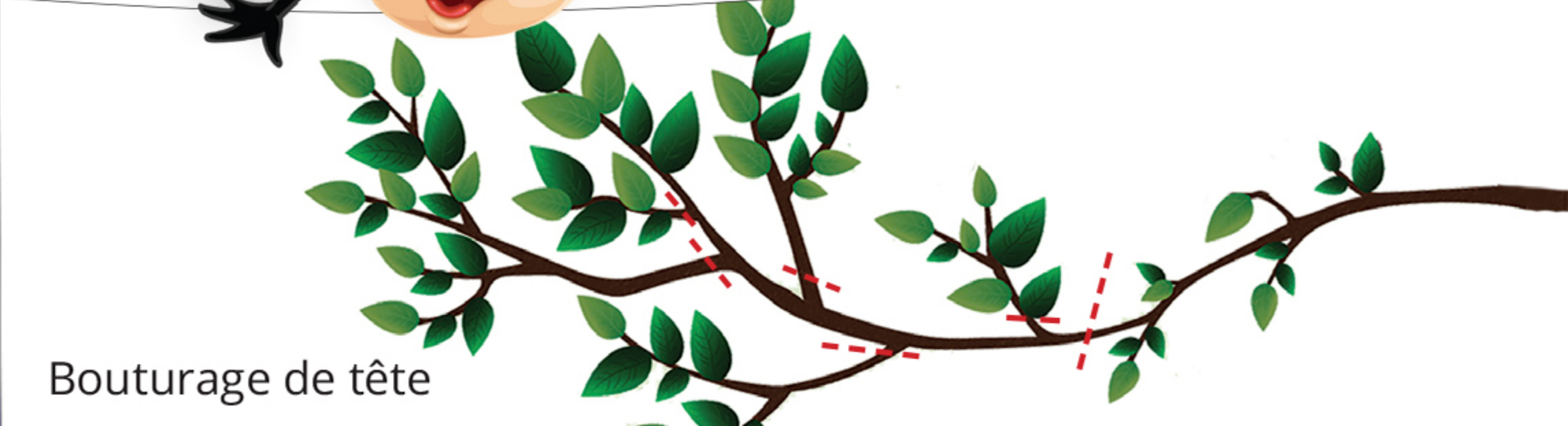
Bouturage de tête