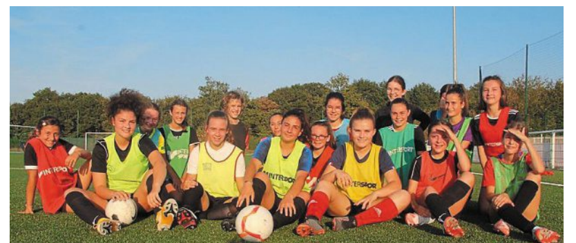
Une partie des filles, lors d'un entraînement en septembre 2020, sur le terrain synthétique de la Salmondière.

Le Réveil sportif Ardelay recrute des footballeuses