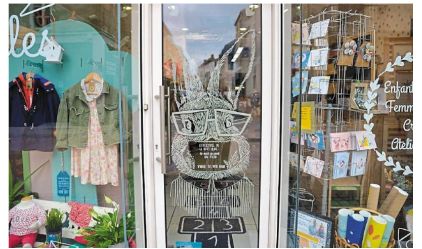
Le lapin à lunettes de Laureen Ginaudeau.

Un lapin à lunettes invite à la découverte