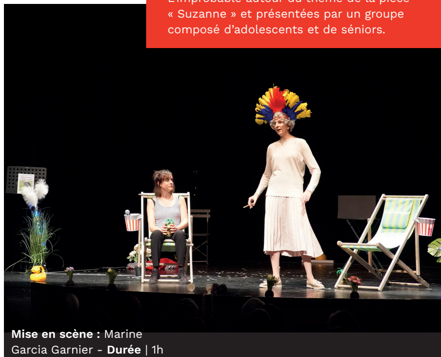
Mise en scène : Marine Garcia Garnier - Durée | 1h

Saynètes créées avec le collectif L'improbable autour du thème de la pièce « Suzanne » et présentées par un groupe composé d'adolescents et de séniors.